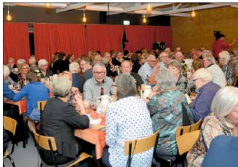
150 mennesker var samlet til premieren på den 32. Næstved Revy.