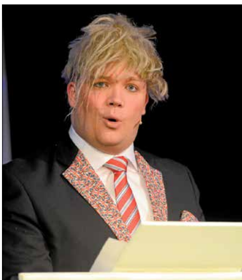
Brexit og Martin Engelbæk som Boris Johnson.

PREMIERE: Energi- en strømmede ud fra scenekanten til premieren på Næstved Revyen, der dog ikke havde så meget Næstved i sig i år.